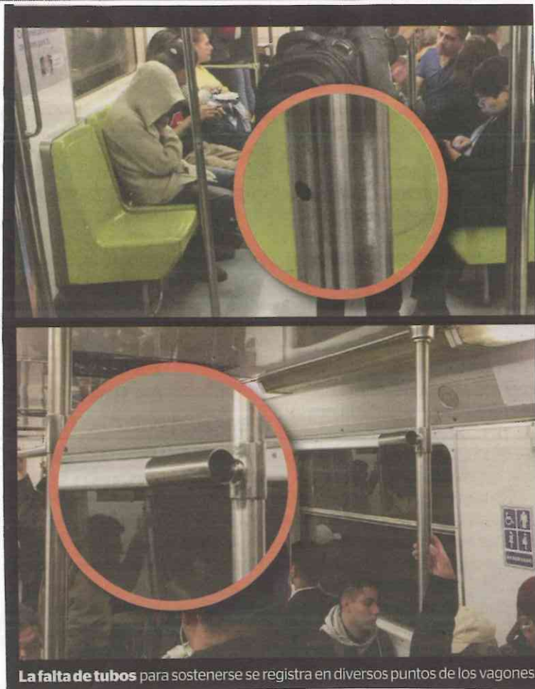
La falta de tubos para sostenerse se registra en diversos puntos de los vagones.