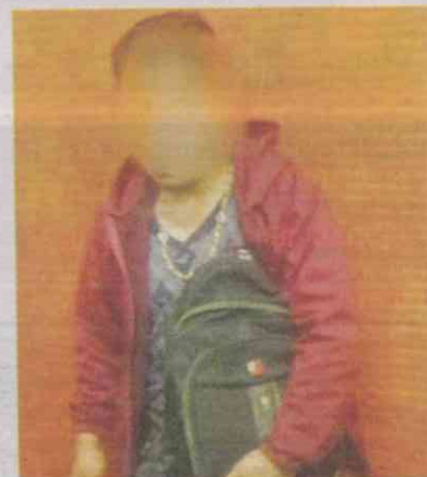
El agresor, de 25 años, quedó a disposición del MP.

El individuo llevaba un vestido de color negro y, cuando los policías lograron ubicarlo, se resistió a la detención.