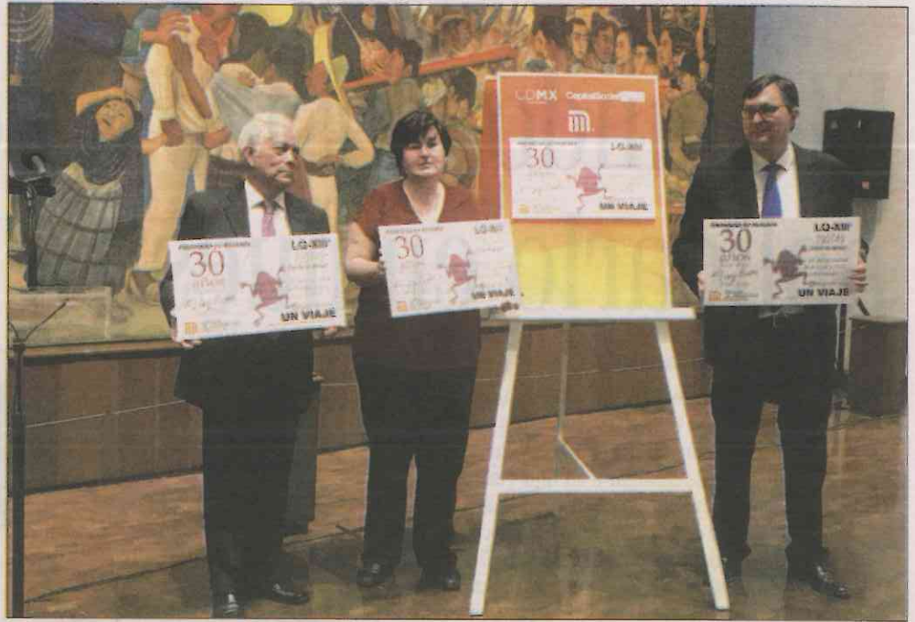
La celebración del recinto también contará con un boleto conmemorativo del Metro.

El director del museo calificó el estado de conservación del mural como “impecable”,