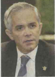
Miguel Ángel Mancera