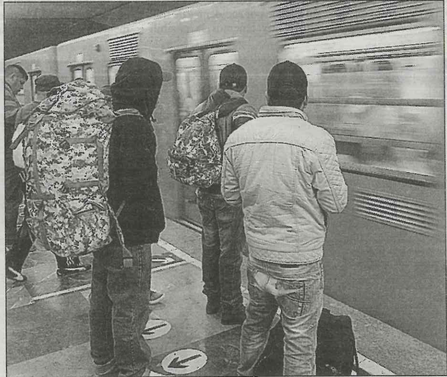
Dentro de las instalaciones del Metro hay 3 mil 400 negocios; algunos empleados del sistema de transporte cobran de forma ilegal a los comerciantes el consumo de energía eléctrica, según denuncias de compañeros

“Vamos a exigir a todos los vendedores que paguen; si se puede poner medi-