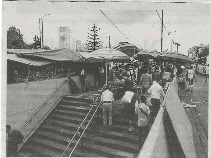
■ Cobran a puesteros por el uso de energía eléctrica