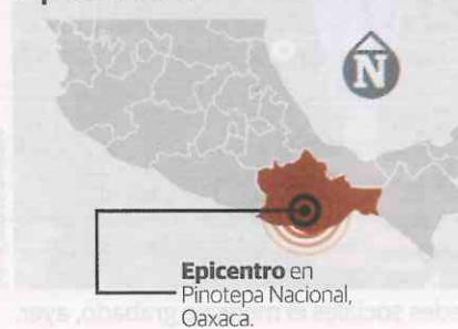
Epicentro en Pinotepa Nacional, Oaxaca.