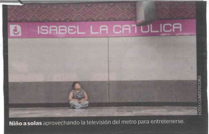
Niño a solas aprovechando la televisión del metro para entretenerse.