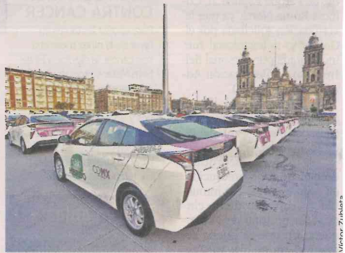
Las nuevas unidades alcanzan los 121 caballos de potencia.

Su eficiencia energética les permite recorrer hasta mil 400 kilómetros por tanque, con un rendimiento de combustible de hasta 30 ki-