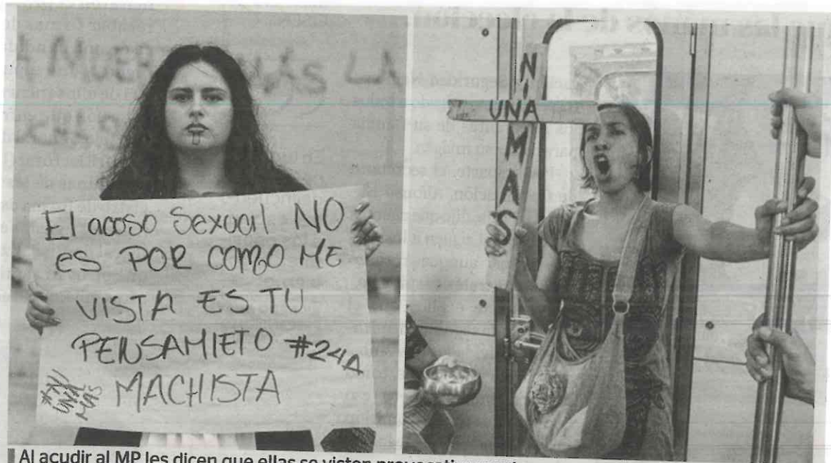
Al acudir al MP les dicen que ellas se visten provocativamente