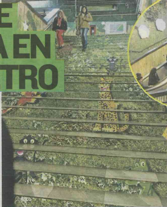
JAVIER RAMÍREZ EL GRÁFICO

El paraíso natural empieza a descubrirse con fichas informativas tamaño gigante que se