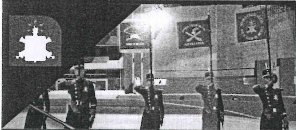
EJÉRCITO Y FUERZA AÉREA MEXICANOS COLEGIO MILITAR, LÍNEA 2. HORARIO DE SERVICIO DEL METRO

Sexta estación emblemática del Metro. En un área de dos mil 400 metros cuadrados se rinde homenaje a hombres y mujeres del Ejército y Fuerza Aérea Mexicanos. Las imágenes versan sobre el sistema educativo militar, planteles como: El Colegio Militar, Áreas de la Salud, Médico Militar, Enfermeras, Odontología, así como el adiestramiento, aplicación del Plan DNIII-E, labor social, desfiles, ceremonias y espectáculos aéreos.