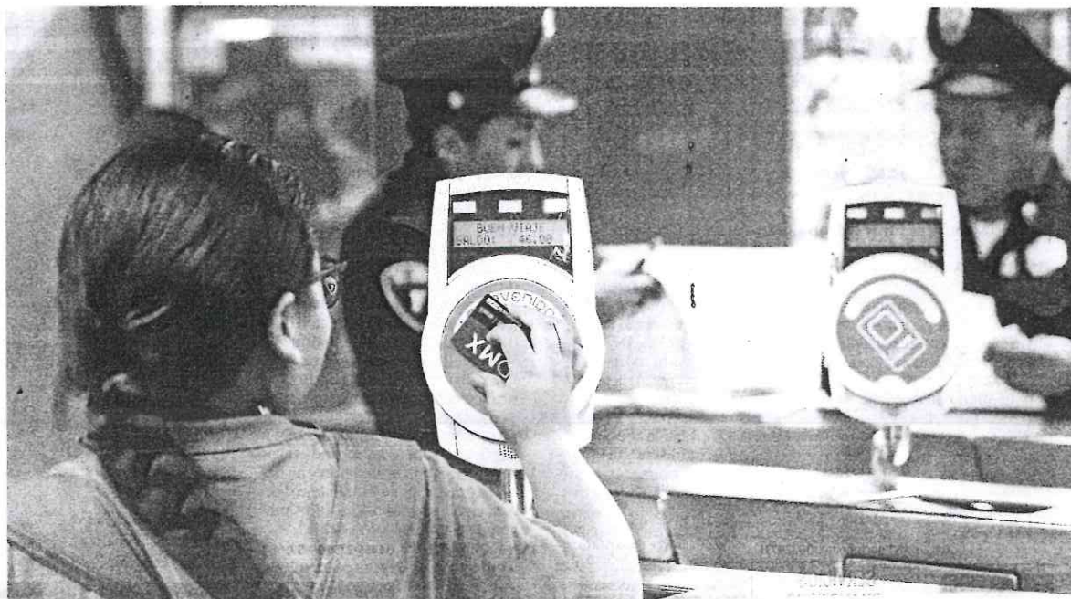
Con el nuevo sistema buscan poner candados a las tarjetas que servirían para el Metro, Metrobús y Transportes Eléctricos.