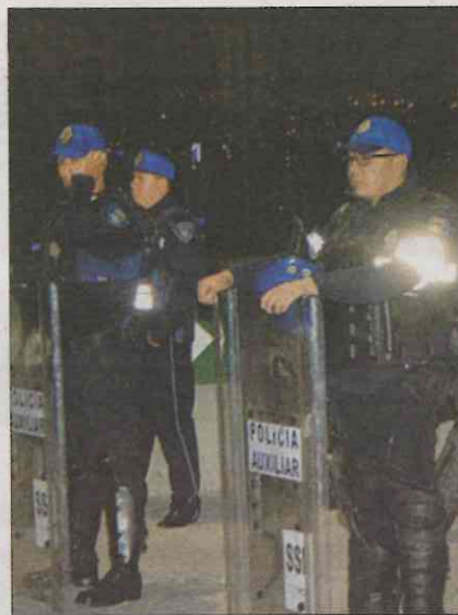
La vigilancia se dará a partir de las 21:00 horas.

"Vamos a estar atentos a ese traslado de quienes tienen clase a altas horas de la noche y todavía tienen que abordar el transporte público para llegar a