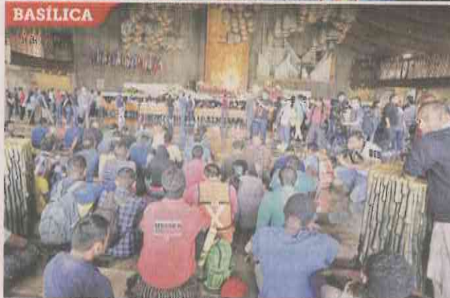
Tras protestar contra la política migratoria de EU, migrantes acudieron a la Basílica de Guadalupe.

visas humanitarias del Instituto Nacional de Migración (INM), que les permite permanecer en México un año.