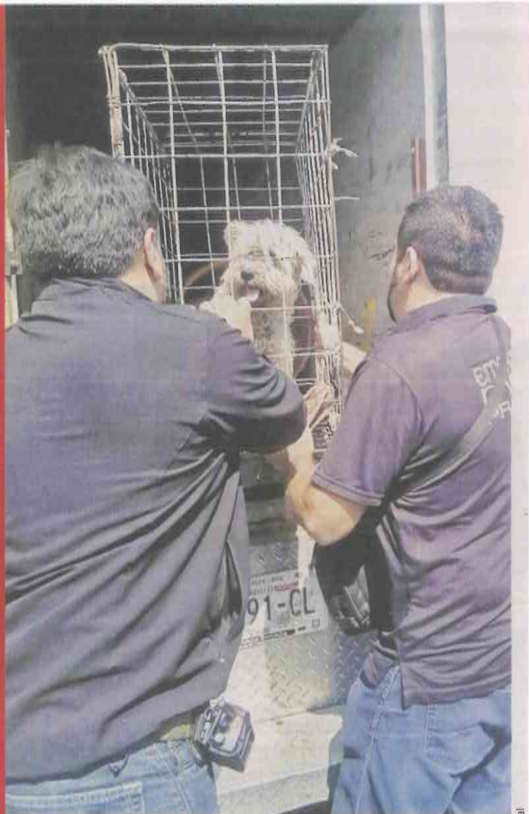
■ Fue nombrado Tlatelolco y canalizado al albergue perruno del Metro.

En el Centro, los perros son revisados por veterinarios.