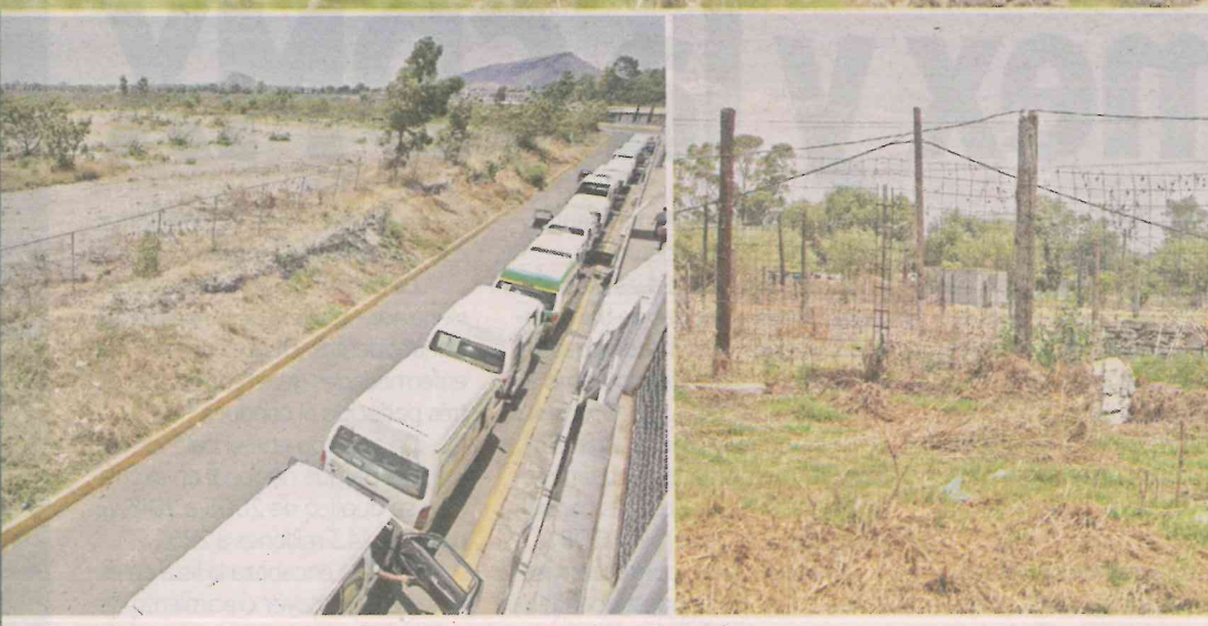
Los colectivos y la mancha urbana ya alcanzaron al paraje verde.

2.5 hectáreas están determinadas para que se haga una laguna