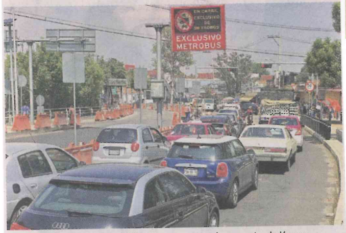
El especialista de la UNAM ve necesario construir líneas del Metro sobre Insurgentes y Reforma.

El siguiente Gobierno en la Ciudad de México tiene que hacer dos líneas de Metro, una sobre Insurgentes y otra en Paseo de la Reforma, que son el corazón de la Ciudad".