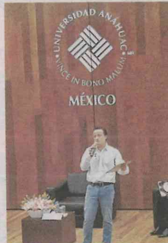
El aspirante tricolor.

Incluso, evidenció que cuando a los otro contendientes por la Jefatura de Gobierno se les pregunta sobre estos temas, “cuando