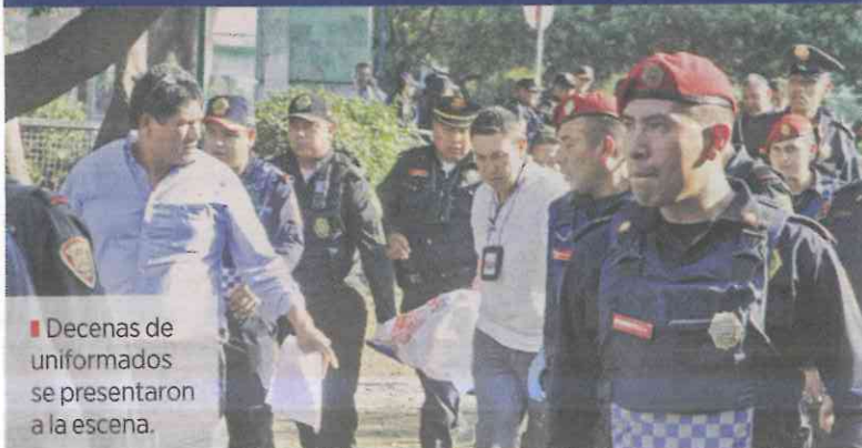
■ Decenas de uniformados se presentaron a la escena.

La escena fue acordonada varios metros y se cerró a los usuarios el acceso donde ocurrió el asesinato.