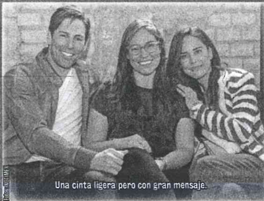
Una cinta ligera pero con gran mensaje.