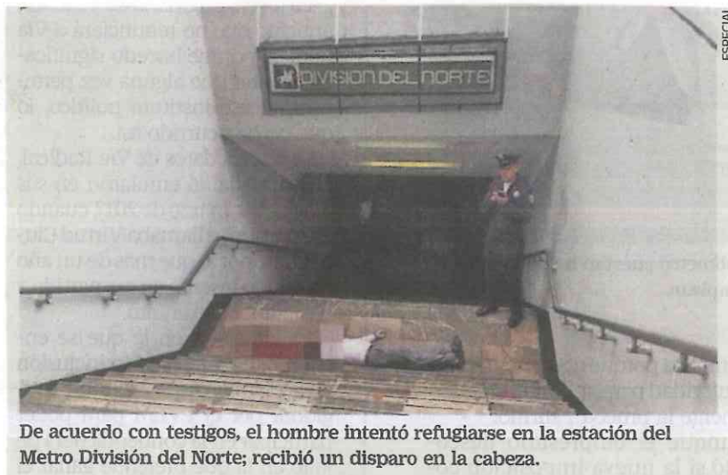
De acuerdo con testigos, el hombre intentó refugiarse en la estación del Metro División del Norte; recibió un disparo en la cabeza.

Este delito, a decir de las estadísticas de la Procuraduría capitalina en el informe que el martes pasado entregó el titular de la dependencia, Edmundo Garrido Osorio, bajó 14% en comparación a los registrados en 2016-2017, sin embargo, los eventos que se han registrado son más violentos porque en todas salen a relucir las armas de fuego. ●