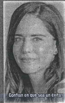
Confían en que sea un éxito.