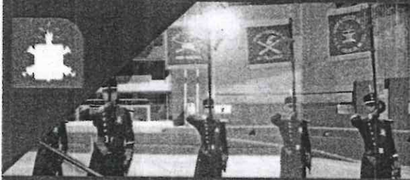
EJÉRCITO Y FUERZA AÉREA MEXICANOS COLEGIO MILITAR LÍNEA 2 HORARIO DE SERVICIO DEL METRO

Sexta estación emblemática del Metro. En un área de dos mil 400 metros cuadrados se rinde homenaje a hombres y mujeres del Ejército y Fuerza Aérea Mexicanos. Las imágenes versan sobre el sistema educativo militar, planteles como: El Colegio Militar, Áreas de la Salud, Médico Militar, Enfermeras, Odontología; así como el adiestramiento, aplicación del Plan DNIII-E, labor social, desfiles, ceremonias y espectáculos aéreos.