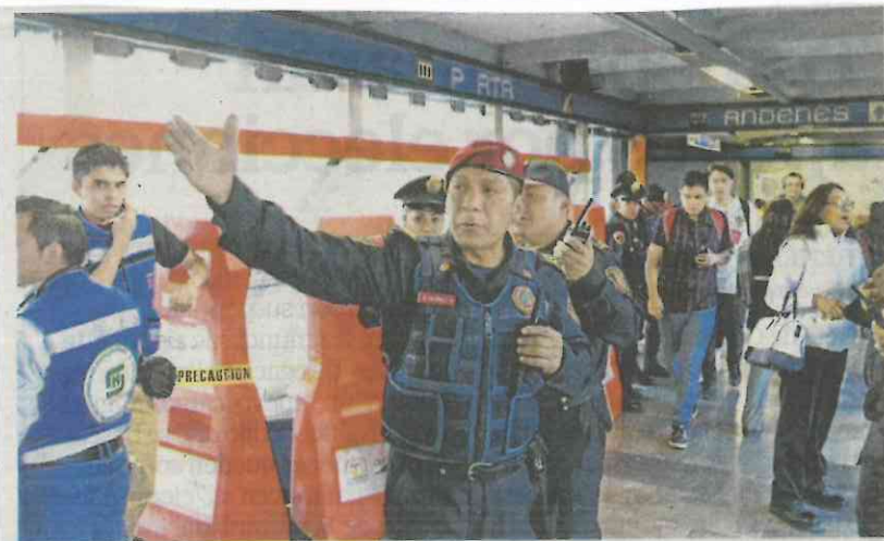
El domingo pasado un hombre de la tercera edad fue encontrado sin vida en los pasillos de la estación Tasqueña; estuvo tirado en el suelo varias horas.

Para evitar el índice de suicidios en el interior del Metro, en agosto de este año entró en vigor el nuevo protocolo de actuación policial de la Secretaría de Seguridad Pública de la Ciudad de México, para la atención de personas con conductas suicidas en la vía pública e instalaciones del Sistema de Transporte Colectivo, cuya intención es precisar las normas en las cuales los policías realizarán las acciones necesarias para salvaguardar la integridad física de las personas con intención de matarse. Hasta el momento se han logrado evitar 34 suicidios. ●