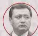
MIGUEL ÁNGEL OSORIO CHONG Coordina campaña de senadores del PRI, Hidalgo