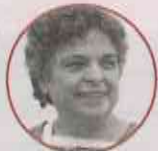
BEATRIZ PAREDES RANGEL Exdirigente nacional del PRI, Tlaxcala