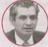
ENRIQUE OCHOA REZA Dirigente nacional del PRI, Michoacán

○ Militante del PRI ○ Ciudadano (a) simpatizante