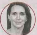
CAROLINA VIGGIANO AUSTRIA Diputada federal, Hidalgo