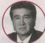
HÉCTOR YUNES Exdiputado local y federal y exsenador del PRI, Veracruz