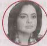
ANA LILIA HERRERA ANZALDO Senadora, Estado de México