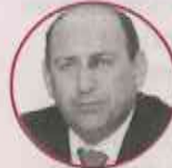
RUBÉN MOREIRA Secretario de Organización del CEN del PRI, Coahuila