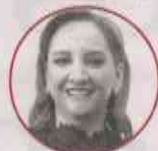
CLAUDIA RUIZ MASSIEU Secretaria general del PRI, Guerrero