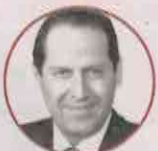
ERUVIEL ÁVILA VILLEGAS Vicecoordinador de la campaña de Meade, Edomex