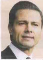
Enrique Peña Presidente de México

“Durante más de 5 años, he contado con el apoyo y protección del Estado Mayor Presidencial en el ejercicio de mi responsabilidad institucional con México. Mi gratitud y reconocimiento a sus integrantes. #DíaDelEstadoMayorPresidencial”