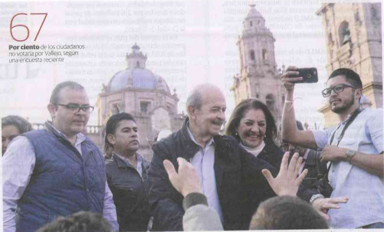
EL EXGOBERNADOR Fausto Vallejo (centro) y su hijo, al anunciar su renuncia al PRI el 10 de enero pasado.

Por ciento de los ciudadanos no votaría por Vallejo, según una encuesta reciente