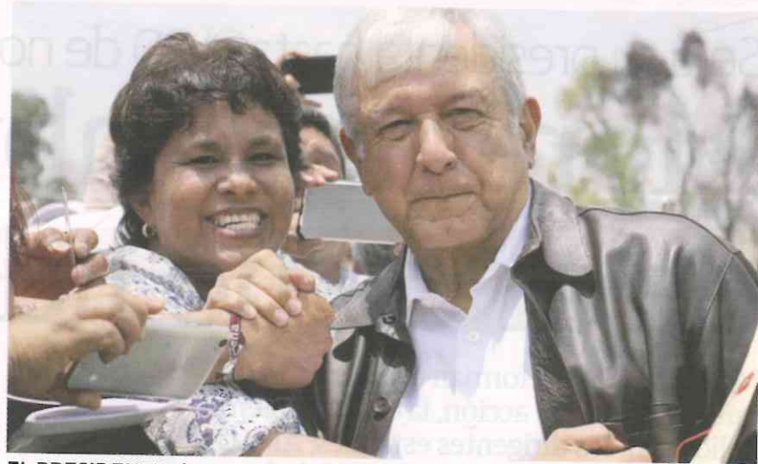
EL PRESIDENTE electo, a su llegada al V Congreso de Morena, ayer.

"Hace seis años, luego de las elecciones de 2012, vivimos un escenario de adversidad, y sostuve que la fórmula era luchar, resistir, no claudicar, caer y levantarse, y así hasta la victoria final, pero ¿qué creen?, todavía no hay victoria final; la habrá cuando no haya pobreza, ni corrupción, ni violencia, y cuando celebre la reconciliación nacional", dijo ante miles de militantes durante la inauguración del V Congreso Nacional Extraordinario de Morena.