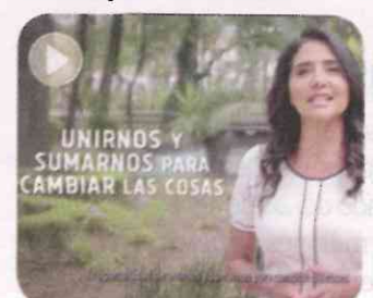
Señala que el Frente es la oportunidad de unirnos "para cambiar las cosas".