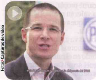
El más reciente del PAN se refiere al litigio de Ricardo Anaya con un medio.

En dos de los cuatro spots en la pauta del PAN la figura es Anaya; en tres de los cinco del PRD, Alejandra Barrales: