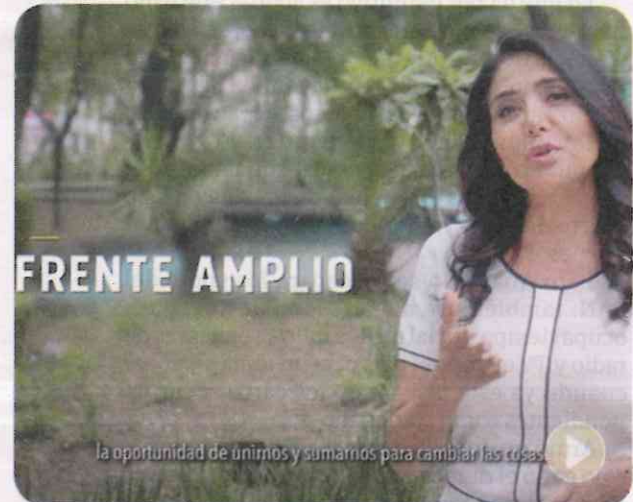
Alejandra Barrales llama a la unidad para sacar del gobierno al Revolucionario Institucional.