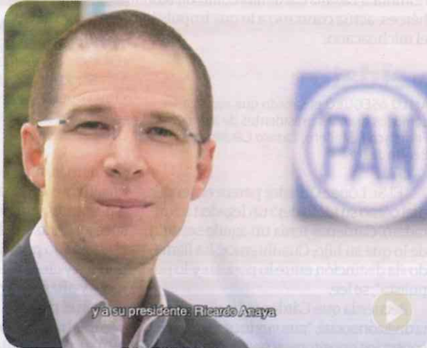
Ricardo Anaya se defiende de acusaciones periodísticas en uno de los comerciales.

Los dirigentes de los institutos políticos protagonizan algunos de los promocionales.