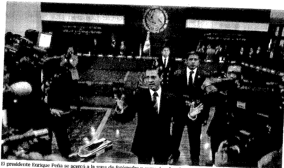
El presidente Enrique Peña se acercó a la zona de fotógrafos y camarógrafos, de donde salieron las voces que demandaban justicia para los periodistas asesinados. Les dijo que México no quiere distinguirse por la censura y la persecución.