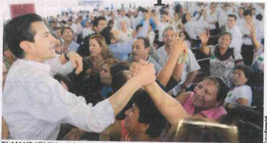
EL MANDATARIO también dio viviendas a damnificados en la entidad, ayer.

E l Presidente Enrique Peña Nieto informó que hasta hoy (ayer) se han entregado 111 mil tarjetas de apoyo para la reconstrucción por los sismos, y destacó que los estados que más han avanzado en el tema son Oaxaca, Chiapas y el Estado de México.