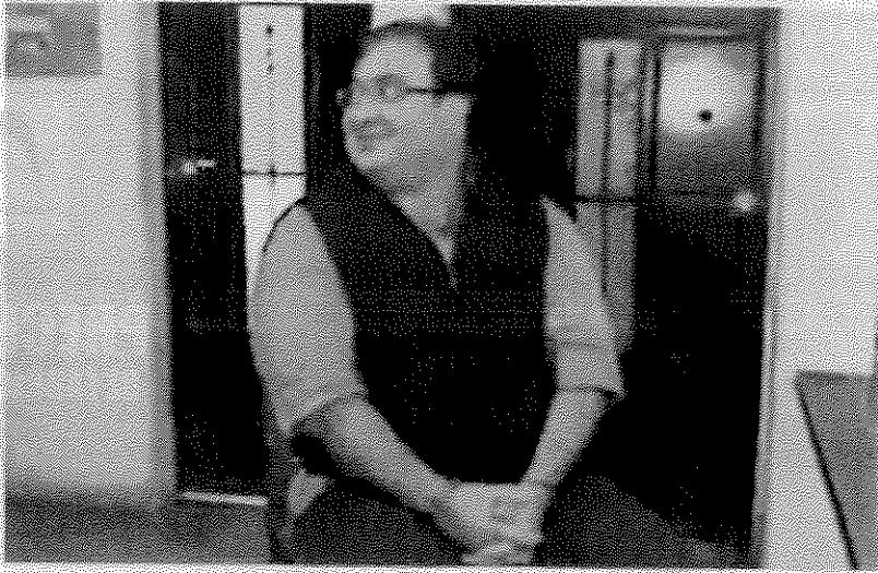
A la patrulla en la que fue trasladado curiosos se aproximaron para ver al detenido. Su sonrisa no desapareció, aun junto a los agentes.