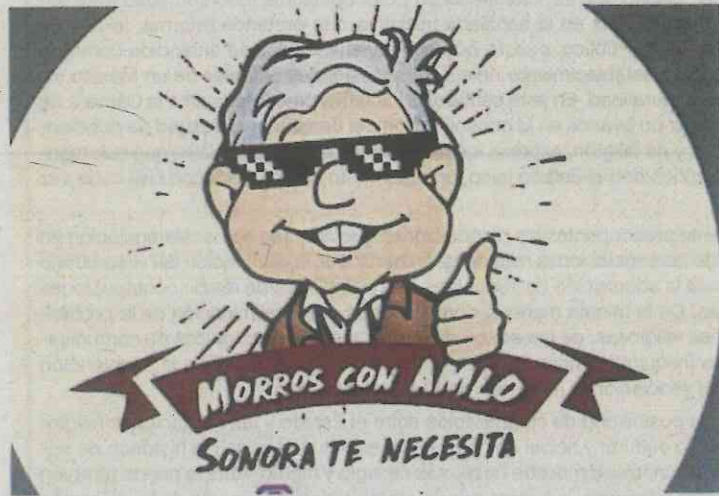
“Morros” apoyan a AMLO

realizó ayer, en una reunión de urgencia entre los integrantes de la Comisión de Honor del partido, quienes iban dispuestos a emitir una sanción, pero finalmente terminaron cediendo ante alguien que metió las manos a su favor. Ahora, nos dicen que al tabasqueño no le quedará de otra que moderarse en sus próximos comentarios, aunque finalmente termine votando por su paisano.