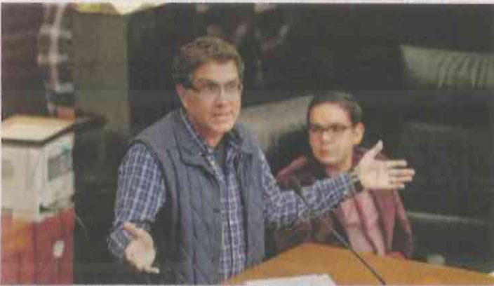
Armando Ríos Piter volverá al Senado

Nos adelantan que una parte importante de la estrategia de la defensa del voto para la campaña de Andrés Manuel López Obrador estará en manos de mujeres. Nos dicen que Beatriz Gutiérrez Müller , esposa de AMLO, recorre algunos estados del país para reunirse con mujeres de Morena, entre otras cosas para formar la estructura de la defensa del voto. La pareja de don Andrés, nos comentan, ha sido acompañada por la coordinadora de la campaña, Tatiana Clouthier , para darle más fuerza y captar a más mujeres a favor de López Obrador. Así que Morena buscará formar su ejército de cazadoras de mapaches.