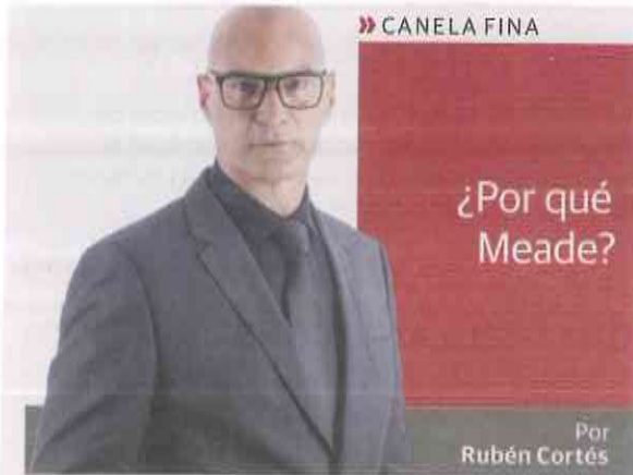
Por Rubén Cortés

E n las encuestas que dan como ganador a AMLO, la tasa de no respuesta es altísima y muestran un segmento igual de altísimo de voto oculto... que se inclina por Meade. Pero, dejemos a un lado esto. A 24 días de la elección, se impone una realidad que se reflejará en las urnas: