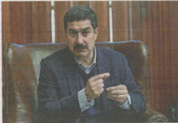
Javier Corral Jurado

sueldo bruto del gobernador es de 155 mil pesos mensuales. Además, nos detallan, Echevarría García aseguró que vive de la liquidación que le dieron tras 20 años de trabajo en el Grupo Álica, consorcio que pertenece a su familia. No obstante, nos hacen ver, lo que el góber olvidó mencionar en su video es si se reducirá el salario que percibe para, además de ser solidario, entrarle a la austeridad. ¡Ups!