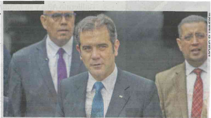
Lorenzo Córdova, consejero presidente del INE

Ya en la etapa final del proceso electoral, el Tribunal Electoral del Poder Judicial de la Federación comenzó la ruta de la calificación de las elecciones presidenciales. Nos dicen que la magistrada presidenta, Janine Otálora , dijo que la ocupación central en estos momentos es la calificación. Es la última fase y no menos relevante de la contienda por la silla del águila, nos explican, porque permitirá definir y establecer si los comicios se realizaron bajo los principios constitucionales. Y de ser así, entregar la constancia de mayoría y declarar presidente electo a Andrés Manuel López Obrador . La fecha límite es la primera semana de septiembre, pero el tribunal lo puede hacer antes, nos comentan.