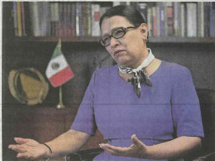
Rosa Icela Rodríguez