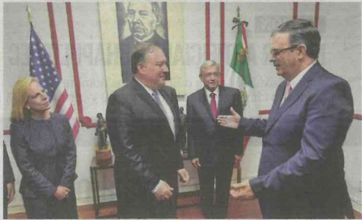
Kirstjen Nielsen, Mike Pompeo, AMLO y Marcelo Ebrard