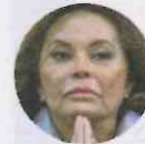
Elba Esther Gordillo

Nos adelantan que mañana la maestra Elba Esther Gordillo dejará ver que se enfocará en la recuperación de la dirigencia del SNTE, que actualmente ocupa Juan Díaz de la Torre. Al quedar exonerada de todos los delitos que se le fincaron, hará hincapié en que fue una presa política y, como se cayó el caso, todos sus derechos y cargos deben serle restituidos.