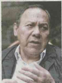
Jesús Zambrano Grijalva