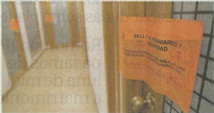
Aspecto de las oficinas en la Cámara de Diputados

En la Cámara de Diputados juran y perjuran que en el éxodo de los diputados que dejan la 63 Legislatura, nadie se lleva nada que no sea suyo. Aseguran que hasta el momento no se tiene registro de que alguien tome algo que esté en el inventario del recinto legislativo y que no sean las televisiones y refrigeradores que los mismos diputados trajeron y son de su propiedad. Por si las dudas, nos aclaran, la Secretaría General ya tomó sus precauciones: además de revisar las cámaras de videovigilancia, instruyeron a la Dirección General de Protección Civil y Resguardo para que tomen "los cuidados correspondientes". Ya ven que con las mudanzas no falta qué se les pueda olvidar. Así que si usted pensó que los diputados salientes estaban saqueando San Lázaro, ¡qué mal pensado!