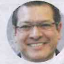
Marco A. Mena

Vergonzoso último lugar en materia anticorrupción ocupa Tlaxcala, gobernado por el priista Marco Antonio Mena. El 18 de julio venció el plazo para que las entidades adecuaran sus normas y las empataran con el Sistema Nacional Anticorrupción, pero en tierra tlaxcalteca aprobaron cero de las siete instancias que debía conformar para combatir ese flagelo.