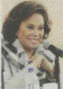
Elba Esther Gordillo