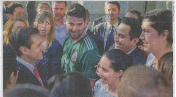
El presidente Peña Nieto con jóvenes en Madrid

La semana pasada le informamos en EL UNIVERSAL que los rectores del país pidieron a los candidatos a la Presidencia de la República que ya no hubiera más de lo mismo y que se comprometieran con una verdadera política de educación superior. Pues ahora los rectores tendrán la oportunidad de hacerlo de frente, al menos con cuatro de los cinco aspirantes a Los Pinos. Nos dicen que justo dentro de una semana la Asociación Nacional de Universidades e Instituciones de Educación Superior (ANUIES) se reunirá por separado con los candidatos Ricardo Anaya , José Antonio Meade , Jaime Rodríguez El Bronco y Margarita Zavala , en el marco de la XXV Sesión Extraordinaria de la Asamblea General de la ANUIES. El único que no asistirá es "ya saben quién".