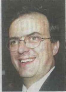
Marcelo Ebrard Casaubón

Ahora todo mundo busca tener la paternidad de la Ley de Amnistía para personas detenidas durante la realización de marchas violentas. Por un lado, diputados de Morena acusan que es un tema que venían demandando desde hace tiempo, y por el otro, los perredistas aseguran que ellos fueron quienes la impulsaron, cabildearon y promovieron. Incluso le recuerdan a los morenos que la nueva legislación beneficiará a los jóvenes que fueron detenidos por órdenes del entonces jefe de Gobierno y ahora asesor de Andrés Manuel López Obrador , Marcelo Ebrard Casaubón , durante la marcha del 1 de diciembre de 2012. Además nos aseguran que esta enmienda es completamente diferente a la planteada por López Obrador que busca, dicen, la liberación de delincuentes de alta peligrosidad y con ello acrecentar los índices de inseguridad que se viven en el país.