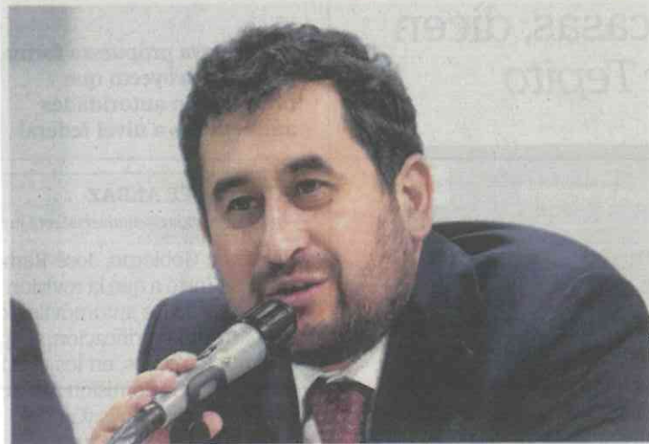
César Cravioto Romero

Marcelo Ebrard Casaubón , durante la marcha del 1 de diciembre de 2012. Además nos aseguran que esta enmienda es completamente diferente a la planteada por López Obrador que busca, dicen, la liberación de delincuentes de alta peligrosidad y con ello acrecentar los índices de inseguridad que se viven en el país.