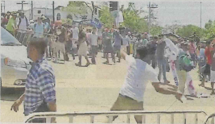
Trifulca registrada en mitin de Meade, en Oaxaca