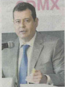
José Ramón Amieva