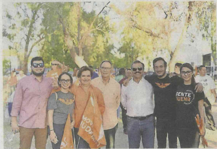
TOMADA DE FACEBOOK