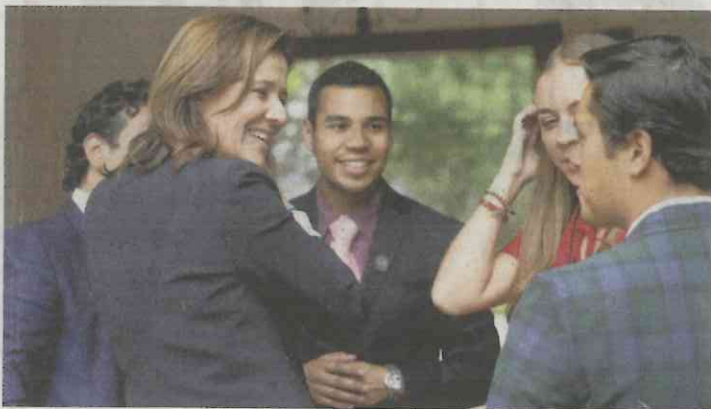
Margarita Zavala, con estudiantes de la UDLAP