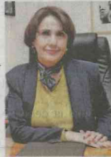
Patricia Mercado Castro

La entrega de documentos falsos por alrededor de 2 mil supuestos afectados en el sismo del pasado 19 de septiembre generó una sangría para la administración capitalina que se estima en 6.2 millones de pesos. Hoy lo que se preguntan es quién va a pagar por esos platos rotos, pues por un lado nos dicen que el encargado de los 18 Centros de Atención Integral era la Secretaría de Desarrollo Económico, pero que también despachaba ahí gente de la secretaria de Gobierno, Patricia Mercado . Por lo pronto, el Gobierno determinó que la Contraloría General de la CDMX investigue y proceda penalmente en contra de quienes cometieron el fraude y que se determine si algún funcionario pudiera estar involucrado.