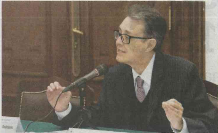
Alfonso Suárez del Real

Si alguien sacó jugo a la presidencia de la Conferencia Nacional de Gobernadores (Conago) ese ha sido el jefe de Gobierno capitalino, Miguel Ángel Mancera . Encuestas muestran que don Miguel es el tercer político con mayor conocimiento en el país, sólo debajo de Andrés Manuel López Obrador y Margarita Zavala , y además un aspirante a la candidatura presidencial, ya sea por el PRD y una coalición de partidos, o bien dentro del Frente Ciudadano por México. Alguna parte de estos índices de conocimiento se lo debe a la exposición que le dio a nivel nacional el cargo de presidente de la conferencia. Pero como a cada capillita se le llega su fiestecita, y como no hay plazo que no se venza, Mancera tendrá que dejar la Conago y con ello la promoción. Aunado a que por el momento ha dejado de hablar de sus aspiraciones presidenciales, Mancera tendrá que trabajar en una estrategia para lograr un regreso potente a la contienda, pues mientras él atiende la emergencia otros tratan de amarrar la candidatura presidencial del Frente y lo pueden dejar fuera de la jugada.