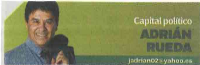
Capital político ADRIÁN RUEDA