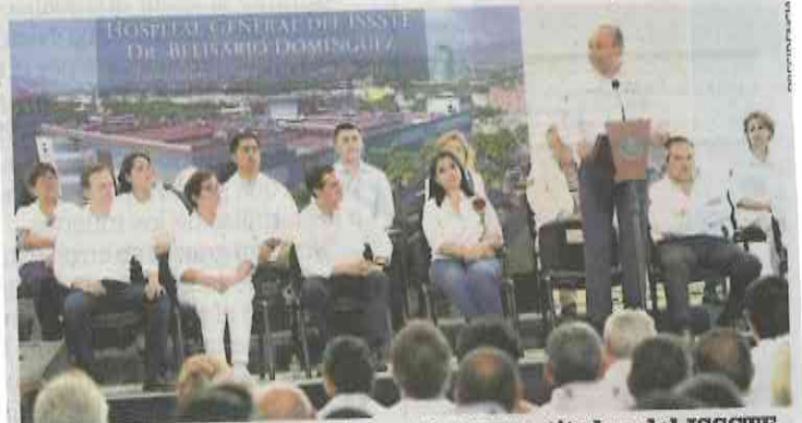
En el podio, José Reyes Baeza Terrazas, titular del ISSSTE

Hay nerviosismo en el Frente Ciudadano por México ante la renovación de la dirigencia nacional del PRD el próximo 9 de diciembre. Un grupo de perredistas no quiere que el nuevo líder del partido, el sucesor de Alejandra Barrales , cancele el acuerdo con el PAN y Movimiento Ciudadano. ¿Por qué el temor? Nos explican que sí hay al interior de perredismo quienes no comulgan con el convenio político de los tres partidos de oposición y quieren sacar ventaja de la renovación interna. Por lo pronto, el jefe de Gobierno de la CDMX, Miguel Ángel Mancera , afirma en entrevista con esta casa editorial que él no va a dividir al Frente. ¿Así o más claro?