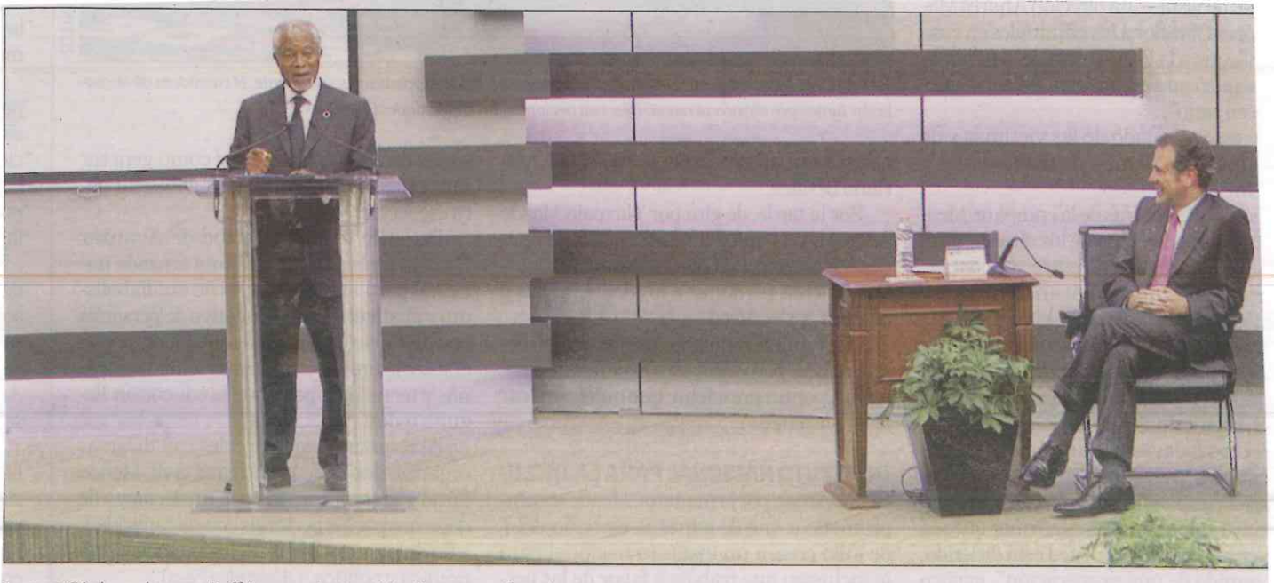
Lorenzo Córdova observa a Kofi Annan mientras éste ofrece su conferencia.