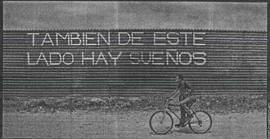
Ninguno de los presidenciables incluye en su agenda las exigencias de la comunidad migrante.

"Si usted intenta hablar por teléfono, porque lo intenté muchas veces, simplemente no contestan, así de fácil (...) Aquí mismo cuando