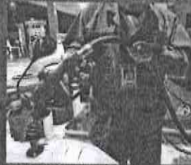
En 6 meses el precio de los combustibles aumentó hasta un 21 por ciento.

Los especialistas advierten que si en el corto plazo la reforma energética no da resultados al ciudadano de a pie, es muy probable que la respuesta de los mexicanos se vea reflejada en las urnas con