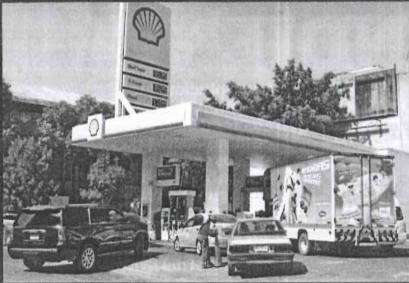
La reforma energética ha contribuido a tener un mercado de hidrocarburos con más competidores.