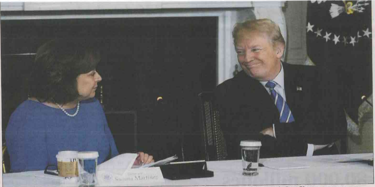
El presidente Donald Trump y la gobernadora de Nuevo México, Susana Martínez, en una reunión ayer en la Casa Blanca.