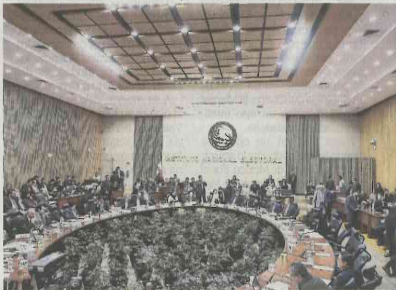
El Instituto Nacional Electoral llegó a un acuerdo con la plataforma digital para que muestre en tiempo real los resultados de la votación.

El memorándum en inglés y español que entró en vigor el 3 de febrero es un acuerdo confidencial que contiene siete cláusulas, pero en ninguna Facebook se compromete al combate de las fake news .