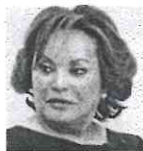
Elba Esther Gordillo Morales

Edad: 73 años. Cargos: Sindicalista y política mexicana. Dirigió el SNTE de 1989 a 2013.