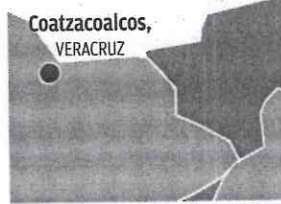
Reporte Pemex | Información: Ignacio Alzaga | Gráficos: Juan Carlos Flores