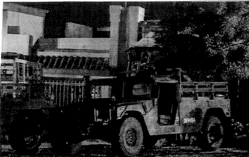
La mayor parte de homicidios se registra en aquellos estados en donde se dan choques frecuentes de uno o más grupos criminales.

Los cárteles del Pacífico, del Golfo, Los Zetas y la fusión de los Caballeros Templarios con la Familia Michoacana podrían pasar del negocio exclusivo de las drogas a transacciones predatorias con ambiciones de control territorial