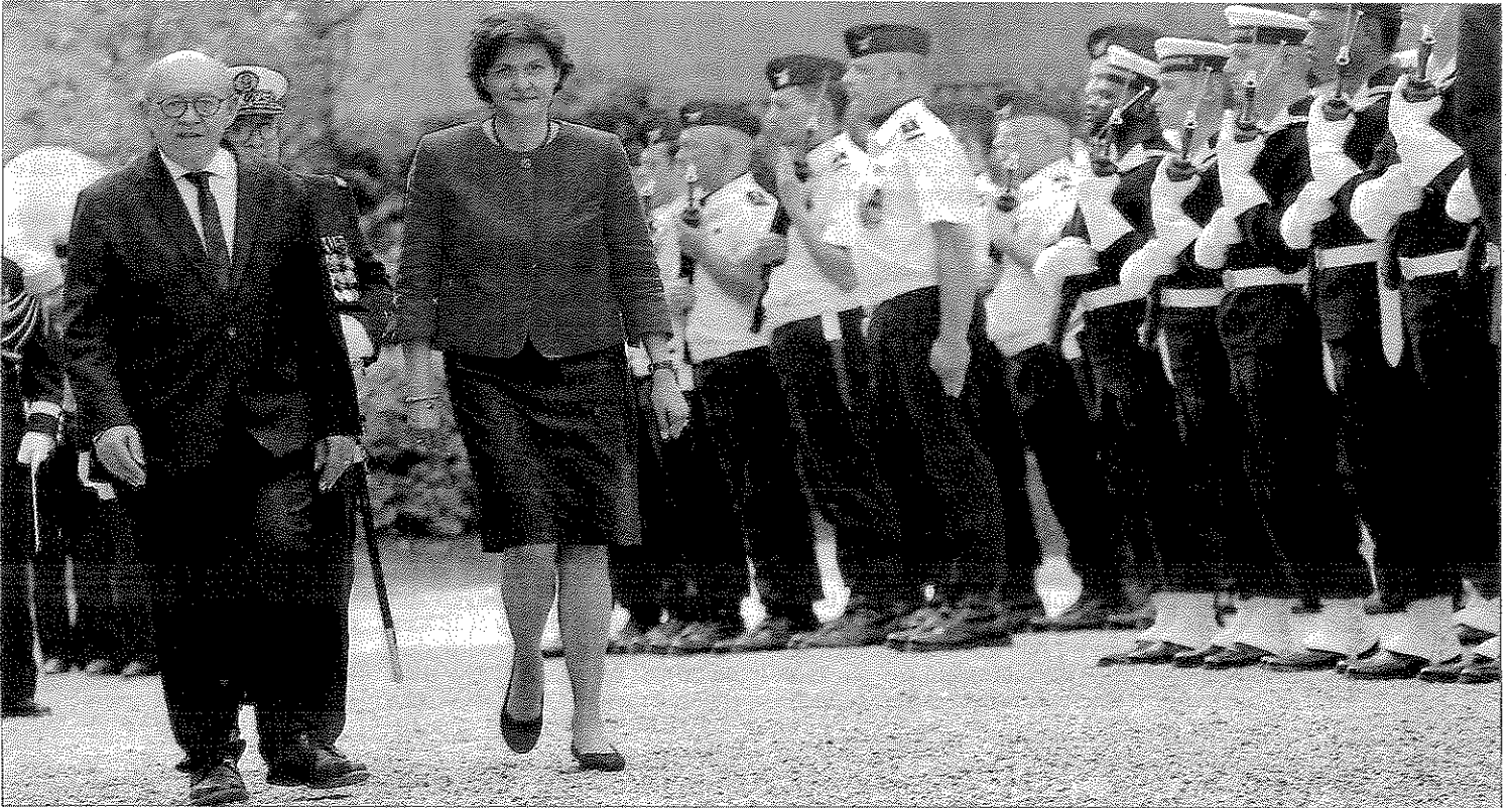
Sylvie Goulard, nueva ministra de Defensa, pasa revista a una guardia de honor con su predecesor, Jean-Yves Le Drian, ayer en París.