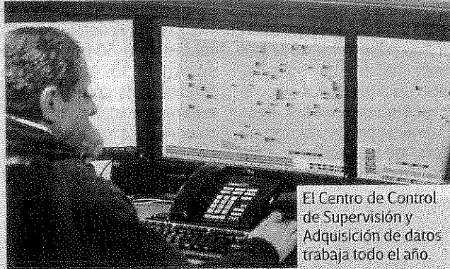
El Centro de Control de Supervisión y Adquisición de datos trabaja todo el año.

Es por ello que una vez que detecta cualquier anomalía, también se informa "seguridad física", quienes señalan con más detalle la zona vulnerada y sellan