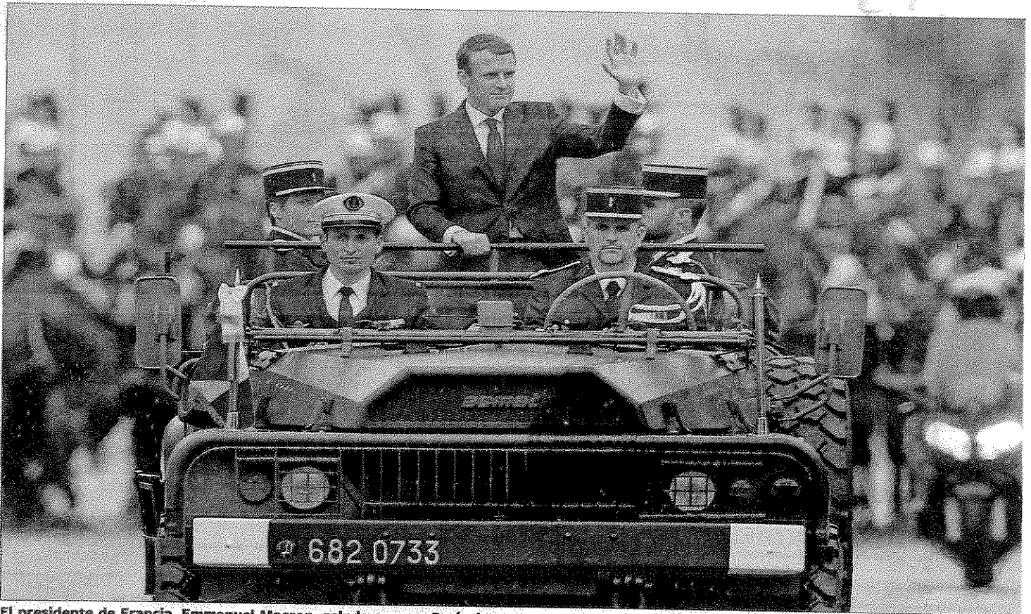
El presidente de Francia, Emmanuel Macron, saluda ayer en París durante su toma de posesión.