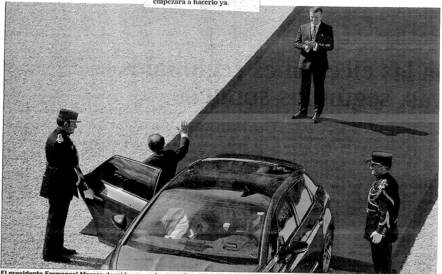
El presidente Emmanuel Macron despide a su antecesor, François Hollande, en el Elíseo.

Emmanuel Macron asumió la jefatura del Estado en un ritual que se repite desde que De Gaulle fundó la V República en 1958. Después se recogió ante la tumba del soldado desconocido; visitó a soldados heridos en combate y se dio un baño de masas ante el Ayuntamiento de París. El traspaso de poderes es el símbolo de la continuidad del Estado. Una entronización republicana: en vez de la corona el presidente recibe el collar de Gran Maestro de la Orden de la Legión de Honor. El elegido entra en el palacio como ciudadano y sale rey. Macron sostiene que la democracia francesa está marcada por un vacío en su centro, una figura ausente: precisamente el rey. "Lo que se espera de un presidente de la República es que ocupe esta función", escribió. El empezará a hacerlo ya.