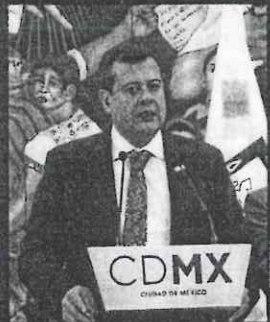
José Ramón Amieva, Jefe de Gobierno, espera que la ALDF redirija recursos para el fideicomiso.

José Ramón Amieva Jefe de Gobierno de la Ciudad de México