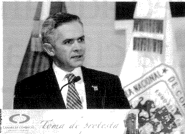
MIGUEL MANCERA ante integrantes de la Canaco, ayer.

EL JEFE DE GOBIERNO agradece a la IP al señalar que la capital genera casi 17% del PIB nacional; llama a empresarios a apoyar el aumento al salario mínimo