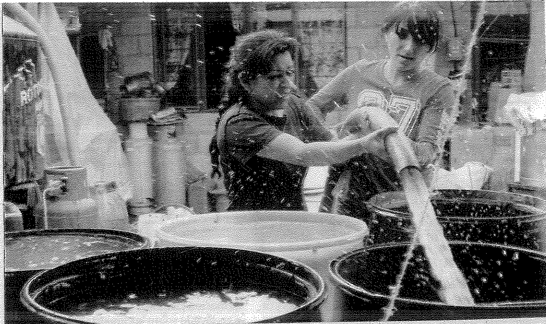
La crisis hídrica ha sido construida "sistemáticamente" en las últimas décadas, dice experta.

"La escasa gobernabilidad en estas décadas ha deteriorado las cuencas, que ya están llegando a sus umbrales, donde ya no hay vuelta para atrás. Esto acarrea un incremento de los conflictos socio-ambientales sin visos de solución porque no tenemos las instituciones apropiadas para lograrlo. La discusión de este problema debe presentar cambios en la manera de cómo hacemos la gestión hídrica para el país".