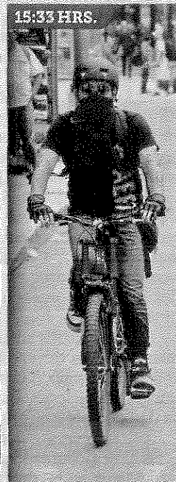
SUFREN. Algunos ciclistas capitalinos se protegieron.