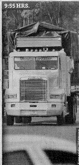
CIRCULAN. Camiones ignoraron la restricción de no circular de 6:00 a 10:00 horas.