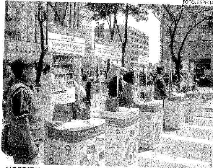
* HOSPITALARIA. La capital tiende una mano a los necesitados.