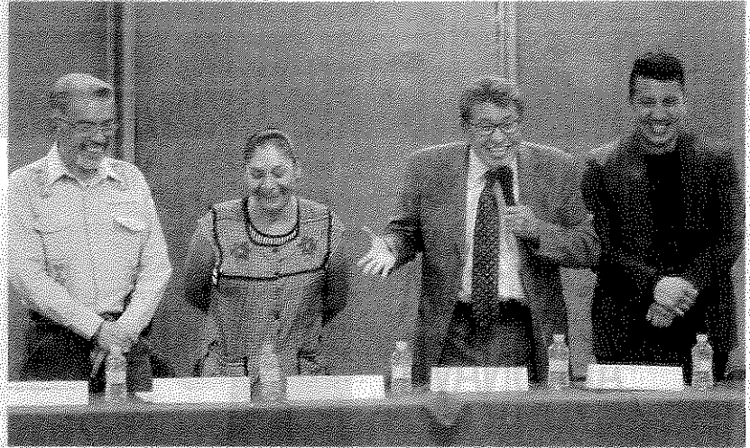
LUCIA CODINEZ, EL UNIVERSAL

El delegado participó ayer en la inauguración del taller de albuces finos en el auditorio del edificio delegacional, el cual se impartirá del 17 al 19 de mayo.