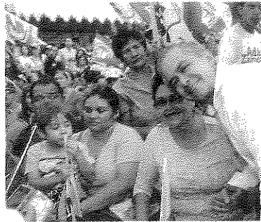
MANCERA, ayer, en Nayarit.