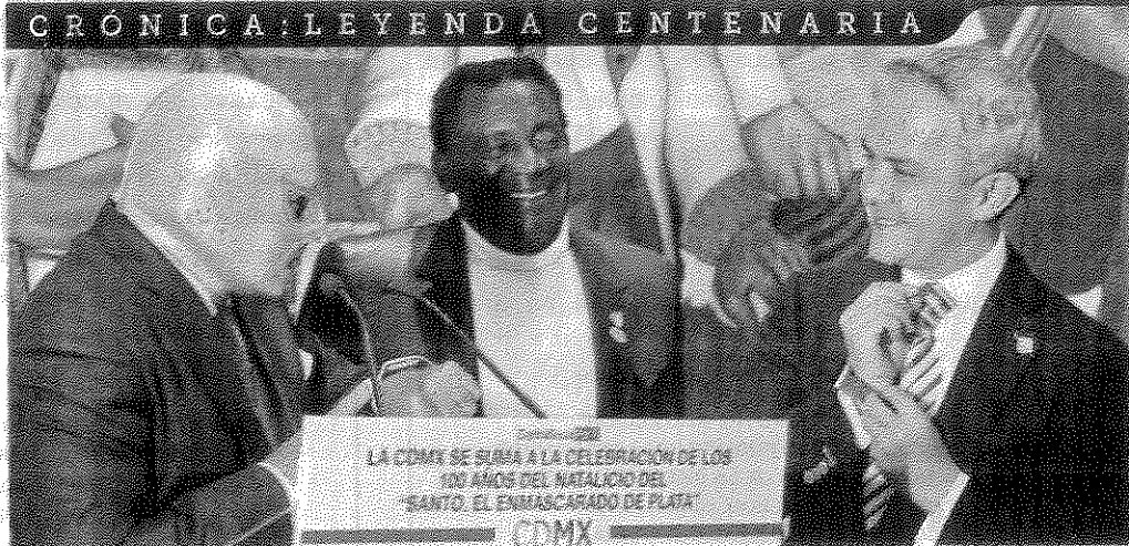
LÍNEA DIRECTA. El Hijo del Enmascarado de Plata regaló un reloj al Jefe de Gobierno.