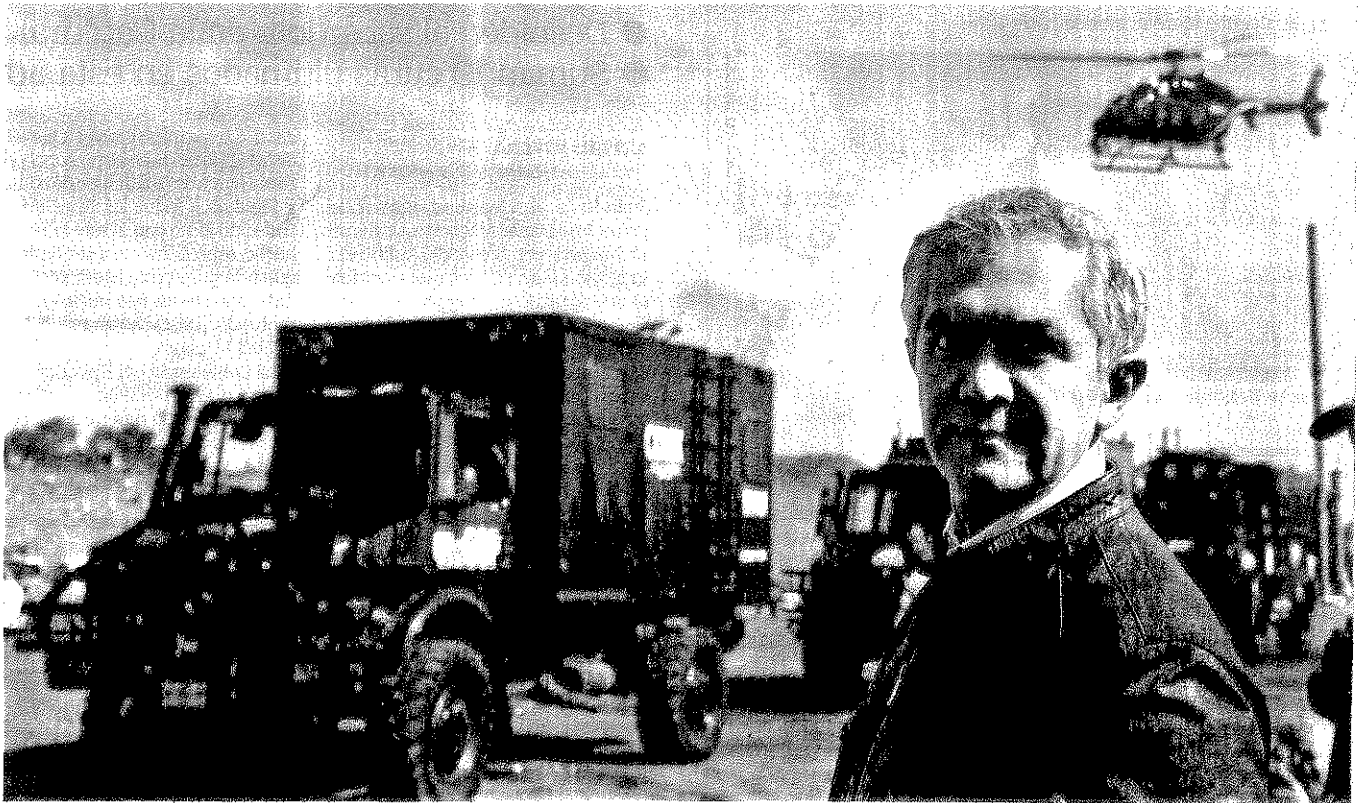
Durante un operativo en Tláhuac, el jefe de gobierno, Miguel Ángel Mancera, afirmó que inhibirán cualquier intento de reorganización del grupo de El Ojos . C1