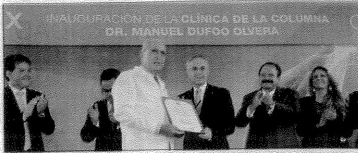
El aparato funcionará en la Clínica de la Columna Doctor Manuel Dufoo Olvera.