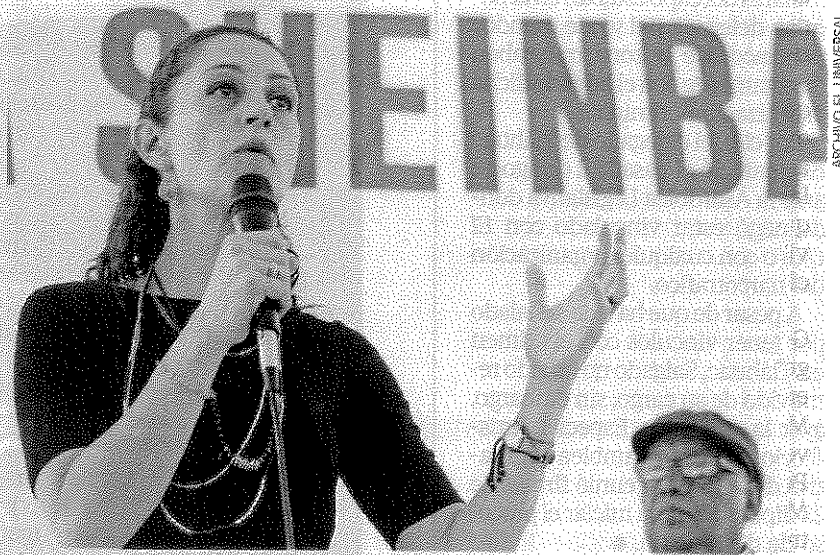
La también delegada en Tlalpan, Claudia Sheinbaum, asegura que el pacto principal es con la ciudadanía y con el PT.

“Han pedido eliminar políticamente como partido al PRD. Llevamos a nosotros como abanderados sería una cosa muy descabellada”, expuso y agregó que el afán de querer destruirlo no es poca cosa, pues por varios años Andrés Manuel López Obrador ha hablado mal del sol azteca. ●