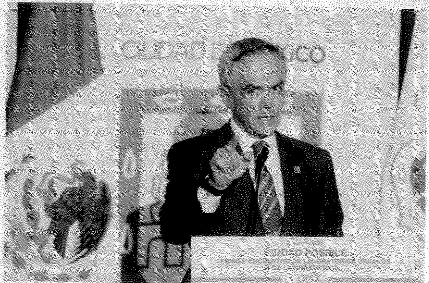
Miguel Ángel Mancera señala que se mantiene trabajando para impulsar “el mayor consenso” y crear un proyecto a favor de los ciudadanos.

“Yo creo que ahí coincidimos mucho, porque además son dos urbes que tienen un gran potencial de cultura y nosotros tenemos que encontrar un desarrollo integral para toda la gente”, agregó. ●